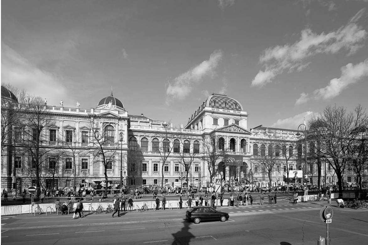
Wienin yliopiston päärakennus Ringsstraselta nähtynä.

Kansainvälisen epigrafiikan seuran ( AI-EGL ) yleiskokouksessa seuraavaksi kongressipaikaksi v. 2022 valittiin Bordeaux; kunniaa saada järjestää kongressi oli kilpailemassa Sardinian Cagliari, joka hävisi kilpailun ainoastaan niukasti.