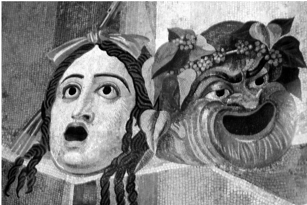
Tragediassa ja komediassa käytettyjä naamioita. Roomalainen mosaiikki, 100-luku.