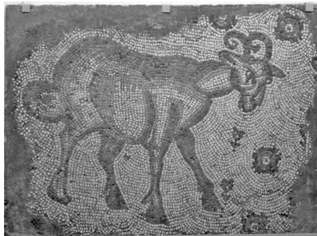
Mosaiikki, pikkupukki, 450–500-luku.

Odotan innostuneena seuraavaa vierailuani Amsterdamiin ja arkeologiseen museoon. Ehkäpä silloin kaikki osastot ovat jo avoinna ja kokoelma esillä uudella tavalla.