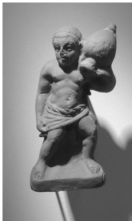
Yllä: Terrakottafiguriini, 100-luku.