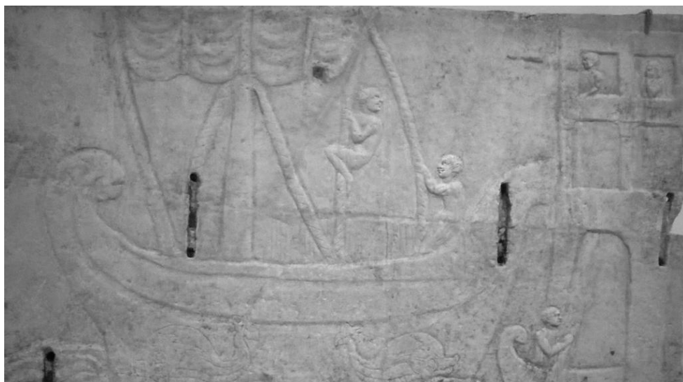
Vasemmallalla: Roomalainen sarkofagi 200-luku.