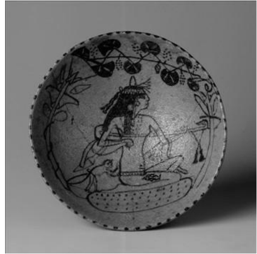
Viinikulho (1400–1300 eKr.), Egypti. Lähde: Rijksmuseum van Oudheden, Leiden.

Hedelmällisyys kultti muuntautuu vähitellen palvomaan juuri jumalatarta, joka antiikin maailmassa tunnettiin mm. nimillä Afrodite, Venus, Ištar ja Hathor. Jumalattarelta haettiin apua rakkauteen, hedelmällisyyteen tai erotiikkaan liittyviin ongelmiin. Uhrilahjoiksi annettiin yleensä jumalattaria esittäviä pienoisveistoksia tai muuta esineistöä. Näyttelyesineistössä sininen fajanssista valmistettu viinikulho (1400–1300 eKr.) esittääkin naista soittamassa luuttua pukeutuneena pelkästään helminauhaan ja vyöhön. Hänen reiteensä on tatuoitu Bes -kääpiöjumala.