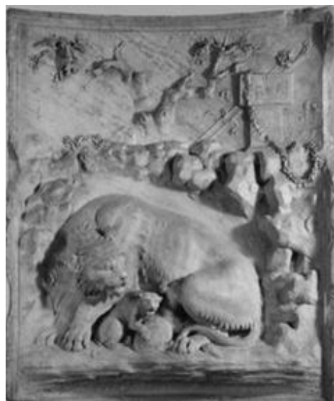
Leijonaemo, Grimani-reliefi. Wienin taidehistoriallinen museo.

Veistosten lisäksi näyttelysaleihin on tuotu suuria reliefejä. Augustuksen kauden taiteessa suosittiin jo hellenistiseltä aikakaudelta traditioksi muodostunutta luonnonilmiöiden kuvaamista. Alkuperäiset kolme Grimani-reliefiä kuvaavatkin herkästi aiheitaan: uuhi ja kaksi karitsaa sekä leijona- ja villisikaemo pentueineen (Wienin taidehistoriallinen museo ja Palestrinan Kansallinen arkeologinen museo). Augustuksen rauhanajan tuottamaa runsautta ja hedelmällisyyttä voi tarkastella myös niin ikään alkuperäisessä Ara Paciksen Tellusta kuvaavassa reliefissä (Louvre, Pariisi). Näyttelyyn onkin kerätty ansiokkaasti keskeistä Augustuksen ajan esineistöä maailman eri museoista.