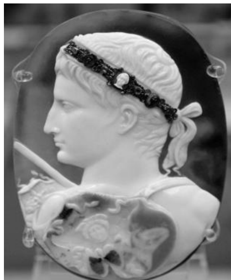
Augustus, Blacas-kamee. British Museum.

Näyttely on upea kokonaisuus ja se onnistuu valottamaan Augustuksen ihanteita ja saavutuksia. Se onkin ensimmäinen Augustusnäyttely Roomassa sitten vuoden 1937. Näyttely myös haastaa vieraansa vertailemaan keskenään esineellisen ja kirjallisen lähdeaineiston antamaa kuvaa Augustuksesta. Se on avoinna 9.2.2014 saakka.