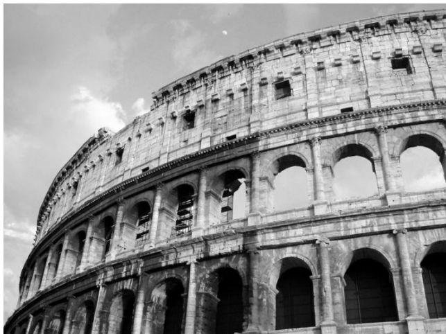
Colosseum, Rooma.

Hotellille palattuani halusin selvittää, löytyykö netistä tietoa Librieriabistrotin sulkemisesta. Ensimmäinen googlen tarjoama sivu tietää vain sen olemassaolosta. On värikästä tarinaa sen avajaisista 5.7.2012, arvosteluja sen gourmetravintolasta ynnä ylistyksiä uudesta konseptista. Seuraavalta sivulta löydän La Repubblica uutisen kirjakaupan viereisen rakennuksen sortumisesta 16.10.2013, joka turmeli myös bistron tilat: Esplode pilastro alla Feltrinelli. Evacuato palazzo in Via del Corso . Tästä kai voi päätellä, että onnettomuuden seurauksena Librieriabistrotin tarina on tällä kertaa päättynyt, mutta olisihan