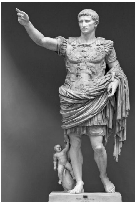
Prima Portan Augustus, Vatikaanin museot.

Roomassa avautui 18. lokakuuta Scuderie del Quirinalessa Augustus-näyttely, joka esittelee mm. veistosten, reliefien, maalausten ja esineiden avulla Augustuksen ajan (63 eKr.– 14 jKr.) taidetta ja aikakauden henkistä ilmapiiriä. Näyttely on rakennettu siten, että kävijä siirtyessään näyttelytilasta toiseen ikään kuin astuu aina syvemmälle Augustuksen ajan taiteen ja kuvaohjelmien syövereihin. Klassikko tunnistaa nopeasti esineistön joukosta luonnollista kokoa suuremmat marmoriveistokset Prima Portan (Vatikaanin museot) sekä Via Labicanan Augustuksen (Museo Nazionale Romano, Rooma) ja pronssisen Augustuksen ratsastajaveistoksen (Kansallinen arkeologinen museo, Ateena). Monet näyttelyvieraista pysähtyvät myös tarkastelemaan eri ikäkausia esittäviä Augustuksen ja keisariperheen jäsenten muotokuvia, vertaillen realistiseen roomalaiseen muotokuvatraditioon tukeutuen heidän ulkonäköään ja yhdennäköisyyttään.