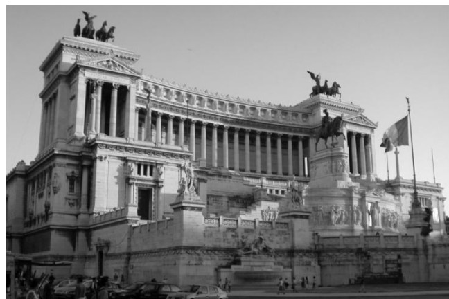
Viktor Emanuel II muistomerkki, Rooma.